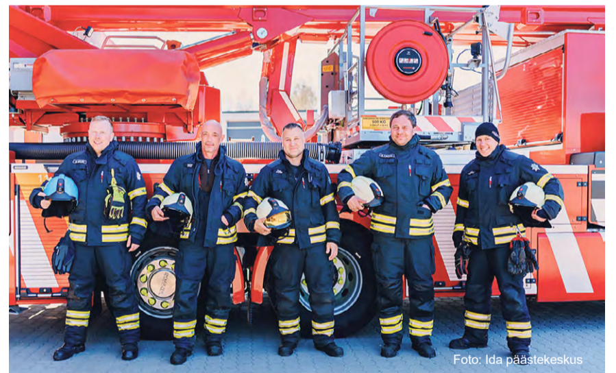
Rakvere päästjad sõitsid 2024. aastal kokku 215 väljakutsele ja masinapark täienes uue korvtõstukiga.

Elanikkonnakaitses on päästeameti ülesanne luua inimestele