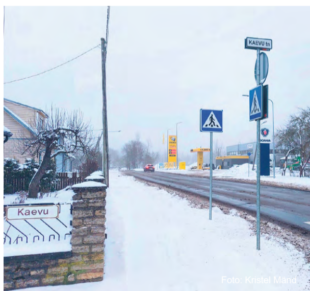
Rägavere teel ehitatakse mõlemale poole kõnnitee.

Remondi käigus ehitatakse uus sõidutee konstruktsioon ja tee saab uue asfaltkate. Oluline on rekonstrueerimise juures see, et mõlemale poole tänavat