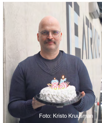
Fotol Peeter Raudsepp

Tuhandeid vorme võtab ka publik ise – üks ja kordumatu igal õhtul just selles kombinatsioonis, ühes ja kordumatus suhtes just sel tun-nil ja hetkel laval toimuvaga. Publikuta jookseksid kõik meie küsi-mised tühja. Ja ehkki oma kordumatuses on iga publiku kombinat-sioon teatritele osa tundmatust, millega silmitsi seista, näib, et teie, publiku üksikliikmed, tunnete meid päris hästi. Siin, kodulinnas, on teie seas palju neidki, kes vaatavad ära kõik meie uuslavastused,