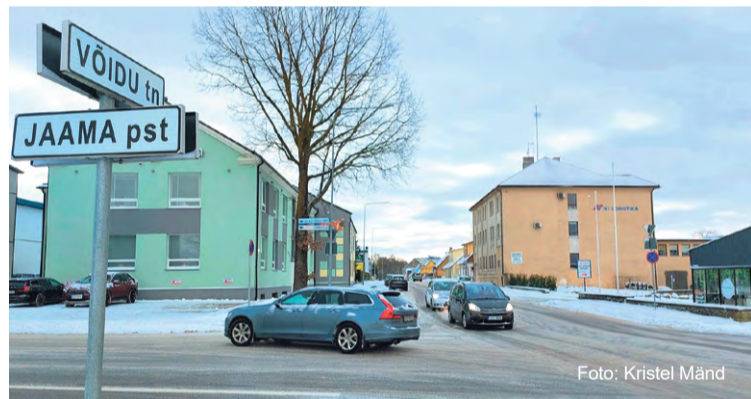
Võidu tänava uuendamine on tänavaaastane suurim teehitusprojekt.