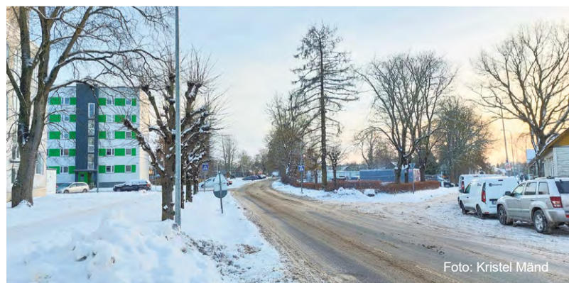
Vabaduse tänava lõik saab uue kuue.

Vabaduse tänav uuendatakse alates Ukuaru muusikamajast kuni Karja tänavani. Kuna muusikamaja valmib 2025. aasta lõpus, on