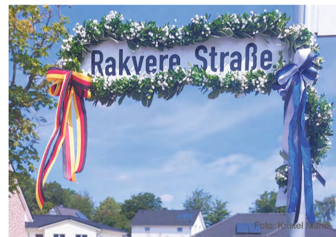
Avamise puhul kaunistati tänavasilt lilledega ja rahvusvärvidega paeltega.