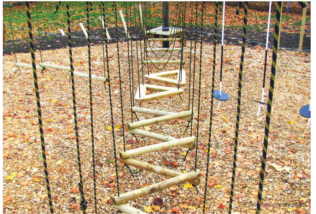
Rakvere reaalkooli spordirajatiste kõrval 25 atraktsioonist koosnev madalseiklusrada.

Seikluspargi elueaks lubas ehitaja 10-15 aastat ja garantii alla kuulub nelja aasta jooksul radade hooldus kord aastas. „Kuna kõigi asjade korrasolek sõltub eelkõige kasutajatest, siis loo-