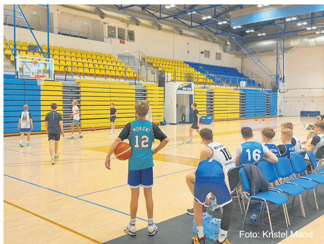
Võistlejad olid hingega mängus.

Suur tänu kõigile osalejatele, kohtunikele, korraldajatele ja toetajatele: Rohuaia kohvik, Wokkin Rakvere, Rakvere spordikeskus, Rakvere linn!