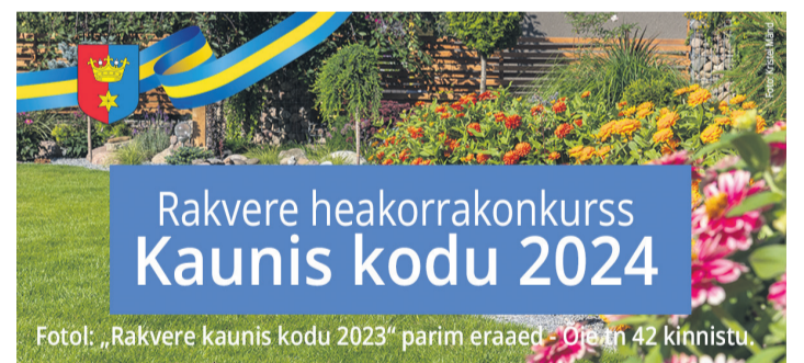
Fotol: „Rakvere kaunis kodu 2023“ parim eraaed - Oie tn 42 kinnistu.

Hindamiskriteeriumid on tehtud EKKÜ (Eesti Kodukaunistamise Ühendus) poolt ja need on aluseks üle kogu Eesti toimuvatele minikonkursidele. Täpsemad juhised leiab Virumaa Kauni Kodu konkursi leheküljelt https://www.virol.ee/konkurss-laane-virumaa-kaunis-kodu- ja EKKÜ lehel https://www.iluskodu.ee/